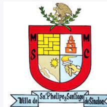
SINALOA DE LEYVA